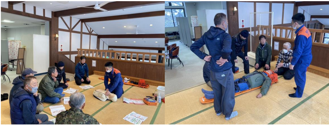
■米子消防署伯耆出張所による救急講習の様子