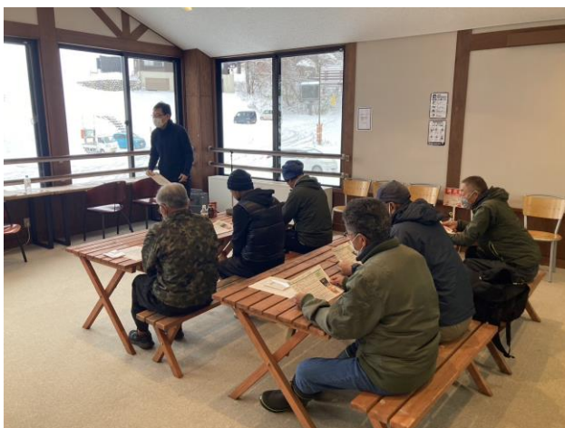
■ 従事員教育訓練の様子