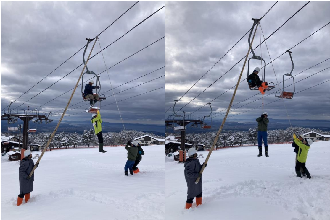
■第2ペアリフトでの救助訓練の様子