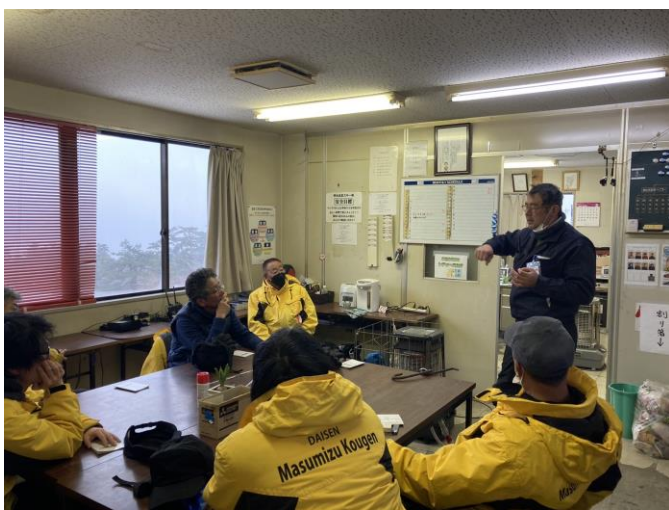
従事員教育訓練の様子

毎年、冬シーズン営業開始前に職員一同にて運転取扱い及び業務従事中の安全行動について研修を実施しています。シーズン中は、索道技術管理者が中心となり、教育指導を適時実施しております。